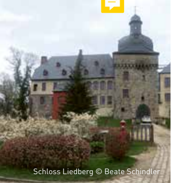
Schloss Liedberg