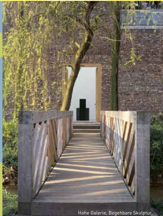
Hohe Galerie, Begehbare Skulptur, Erwin Heerich