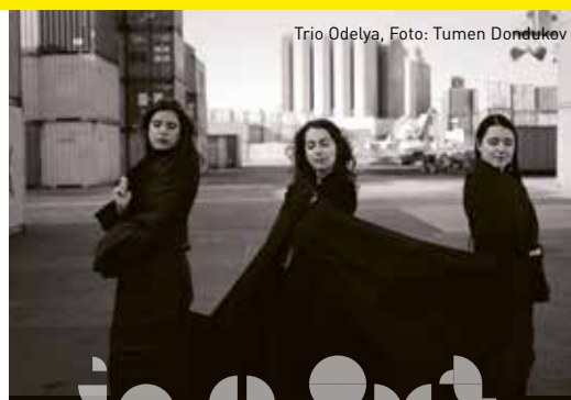
Trio Odelya

Das Festivalprogramm startet im idyllische Örtchen Liedberg. Junge internationale Komponist:innen der AvantGarten Liedberg 2022 laden ein zu einer musikalischen Entdeckungsreise in historische Gebäude und blühende Gärten, zwischen draußen und drinnen, Geschichte und Gegenwart, Kunst und Kulinarik. Wer etwas Zeit mitbringt, sollte sich das Lichtfestival am Vorabend auf Schloss Dyck nicht entgehen lassen. Es ist nur wenige Fahrradminuten von Liedberg entfernt und kann mit Übernachtung im Gesamtpaket gebucht werden. Ein erster Vorgeschmack auf das Ausflugsangebot der MUZIEK BIENNALE , das den Konzertbesuch ausweiten möchte zu einer TOUR d´horizon am Niederrhein.